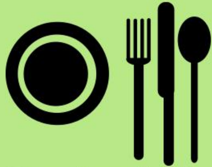
Bwyd a diod